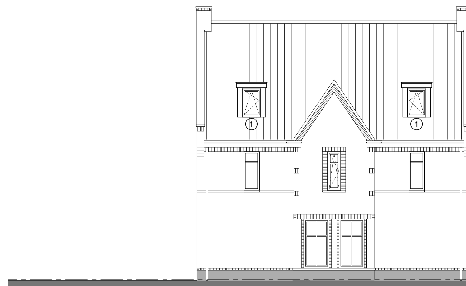
Zijgevel rechts woningtype A