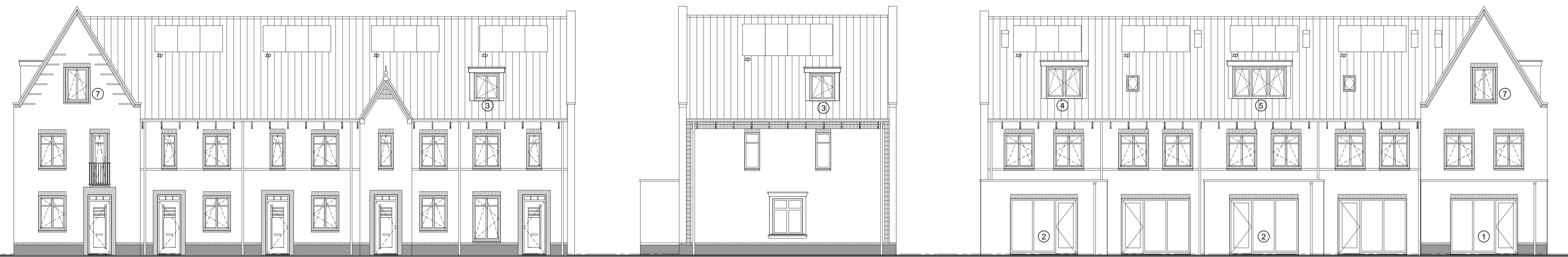
Voorgevel type N-sp type U type U type T type O-sp