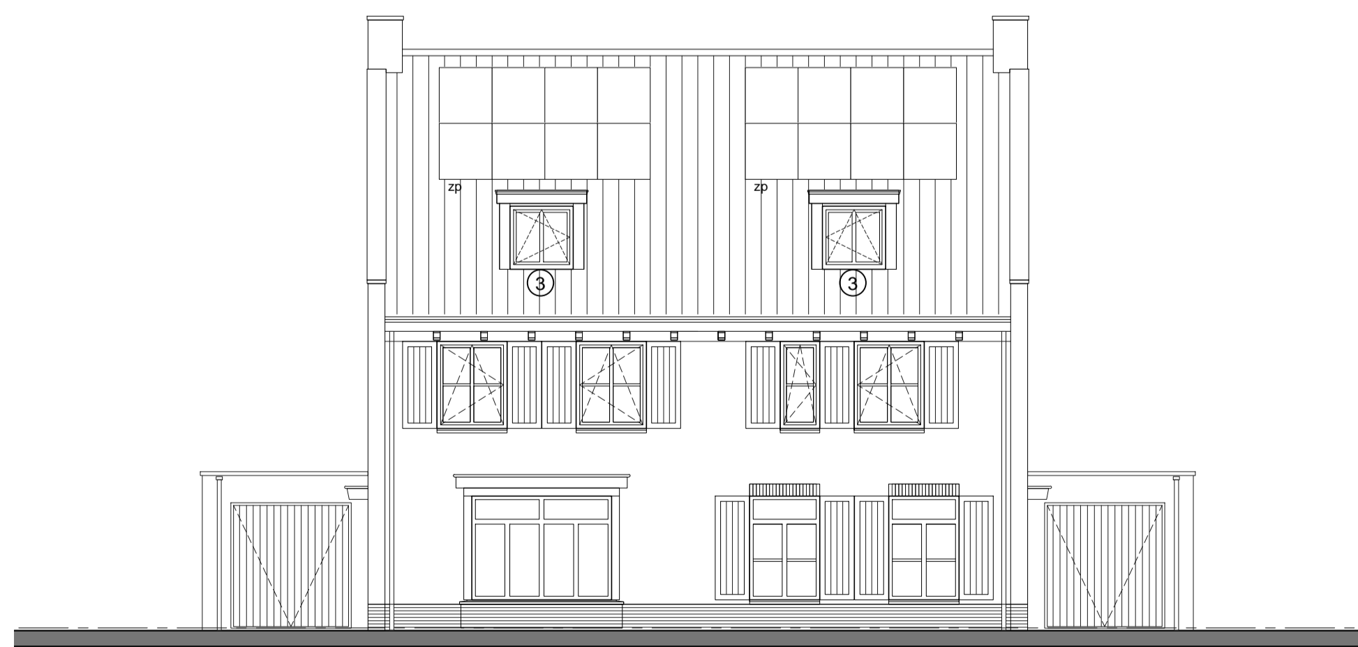
Voorgevel type F type F-sp

Opmerking: Aangegeven zonnepanelen alleen bij bouwnummer 47 en 48