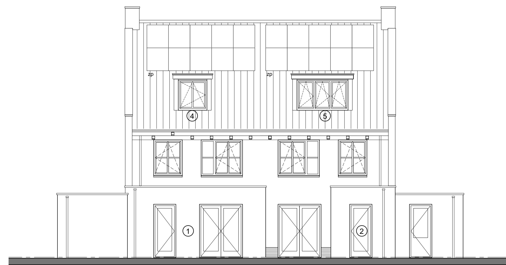
Achtergevel type F-sp type F

Opmerking: Aangegeven zonnepanelen alleen bij bouwnummer 47 en 48