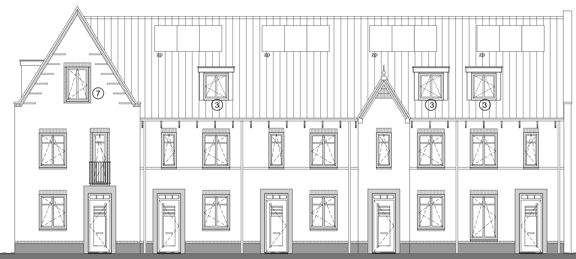
Voorgevel type N-sp type U type U type T type O-sp