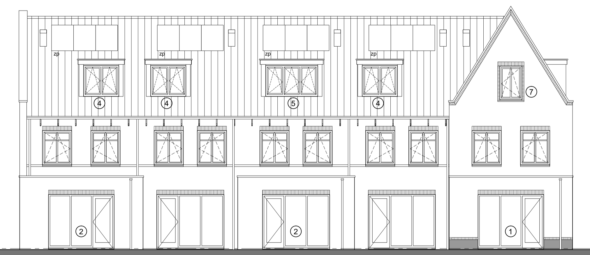
Achtergevel type O-sp type T type U type U type N-sp